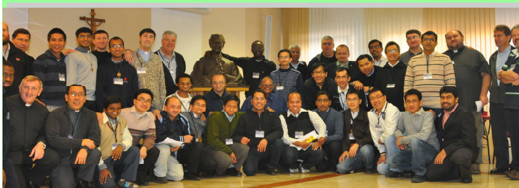
Участники первой встречи Салезианских миссионеров в Европе - Пизана, 25-27 ноября 2011

Все это должно помочь Салезианцам, которые работают на этом контексте достичь такого мышления, чтобы их труд являлся более и более европейским, укрепляя взаимодействия среди Инспекторий в различных секторах и укрепляя сотрудничество на региональном уровне». Итак, какой вклад я могу сделать для проекта "Европа"?